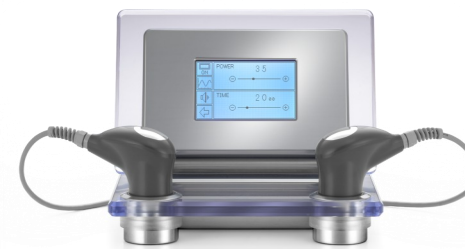
SIRIO B/N SP-120 e SIRIO COLOR SP-121